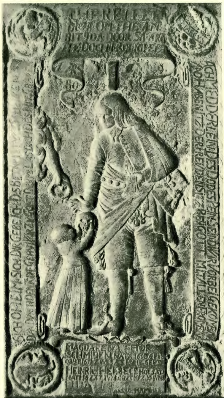
LIGSTEN I DET TERSMEDENSKE KAPEL I SÖDERBÄRKE. Udført c 1653 af Frederik Herman Hoyer (c 1621—1698).