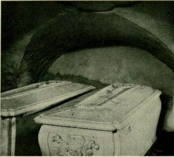
GATHENHIELMSKA SARKOFAGERNA I ONSALA KYRKA.