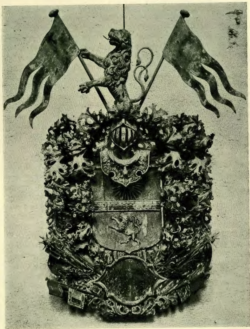
GATHENHIELMSKA HUVUDBANÉRET I ONSALA KYRKA.

under Stralsundiske belägringen lätit sig angelägit wara, att bij-springa Staden med det som till Trouppernes uppehälle kunde tarf-was, hwilket fast han eij hade den lyckan att kunna bringa fram, aldenstund han skulle igenom Sundet, och således så gått som mit igenom den Fiendtlige Flottan, då Fahrtyget som af Fienden blef