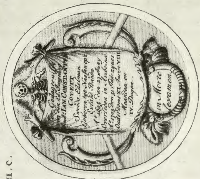
Minnespenning över Jan Constantijn Coyett (1693—1705). Plakettmedalj av Wouter Muller omkr. 1660; gravyren delvis tillagd 1705. Efter F. Valentijn 1724, Foto: ATA.