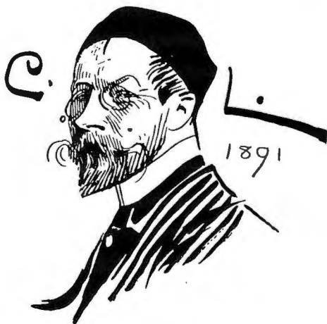
Carl Larsson Självporträtt