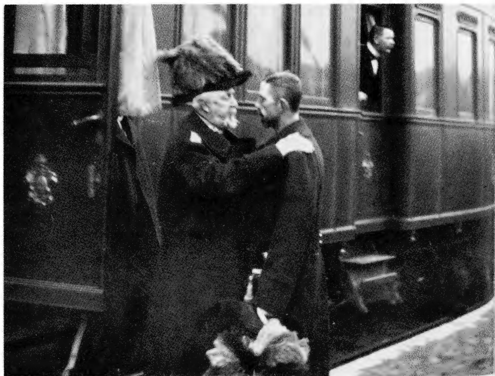
Oscar II och Gustav V

I ljuset av sådana händelser kan man förstå Oscar II intressen för dynastiska frågor. Han ville framstå som den samlande symbolen för de förenade kungarikena Sverige-Norge, och genom att påvisa sitt eller sina avkommors släktskap med ländernas gamla kungaätter kunde han lättare hävda sina kungliga maktanspråk. Han antyder själv någonting i den vägen i sin memoarer, när han tillmäter överförande av kistorna med Gustav IV Adolf, hans son och sonson till Sverige "nationell" betydelse.