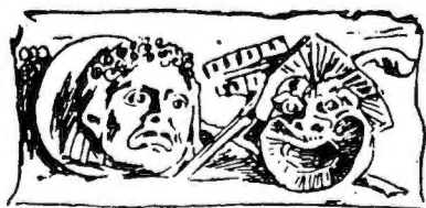
Vinjett av Carl Larsson

vilka redan vid 1600-talets slut ansågs ha passerat sin bästa tid. Representanter för dessa har språkforskaren Olof Celsius d. ä. och orientalisten Jacob Jonas Björnstål fått bli. Den senare, vars Italienfärd inföll 1770–73 tillhörde dem som till fullo uppskattade Rom. Han framhåller och lovordar framför allt arkitektur, fontäner och parker, de intressanta museerna och biblioteken. Han förefaller företrädesvis finna sitt umgänge i de främst av utlänningar bestående konstnärskretsarna. Av svenskar var Sergel den mest berömde; han stannade vid sin första vistelse i staden i elva år från 1767. Sergel omnämns i flera av bidragen, där varken hans återkommande depressioner eller detaljer i hans skulptörverksamhet saknas.