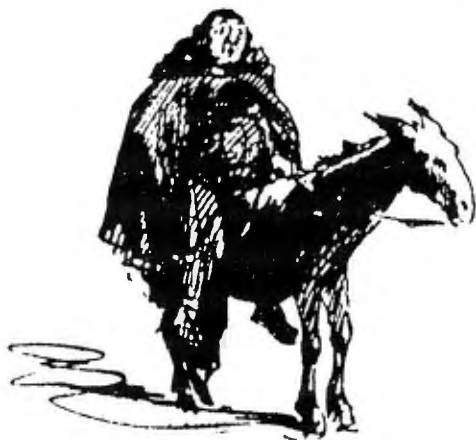
Teckning av Carl Larsson

nes stillsamma och fridfulla besök framstår Egron Lundgrens beskrivning av staden under revolutionsåret 1848 då påvens premiärminister greve Rossi blev knivmördad i deputeradekammarens lokaler och Pius IX själv, förklädd, måste fly från staden mot Neapel, eller då Lundgren blev rånad på Spanska trappan i januari 1849. Falkman beskriver hur han i november 1864 i sällskap med bl. a. Snoilsky går på krog nära Pantheon för att uppleva en romersk saltarella, en dans "ungefär detsamma som kankan, men . . . mindre gratiös och mera poetisk".