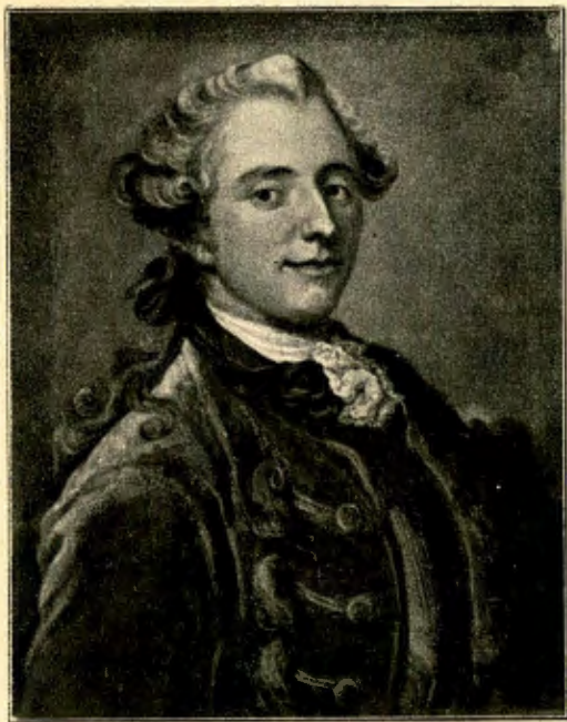
N:R 19. RIKSRÅDET GREFVE F. U. VON ROSEN. (OLJEMÅLNING TILLH. MINISTERN C. BURENSTAM Å TJELFVESTA.)