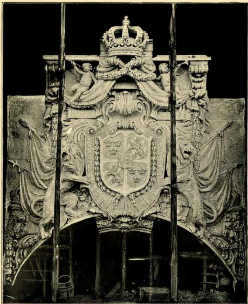
GIPSMODELL TILL RIKSVAPNET ÖFVER DET BLIFVANDE RIKSDAGSHUSETS HUFVUDINGÅNG.