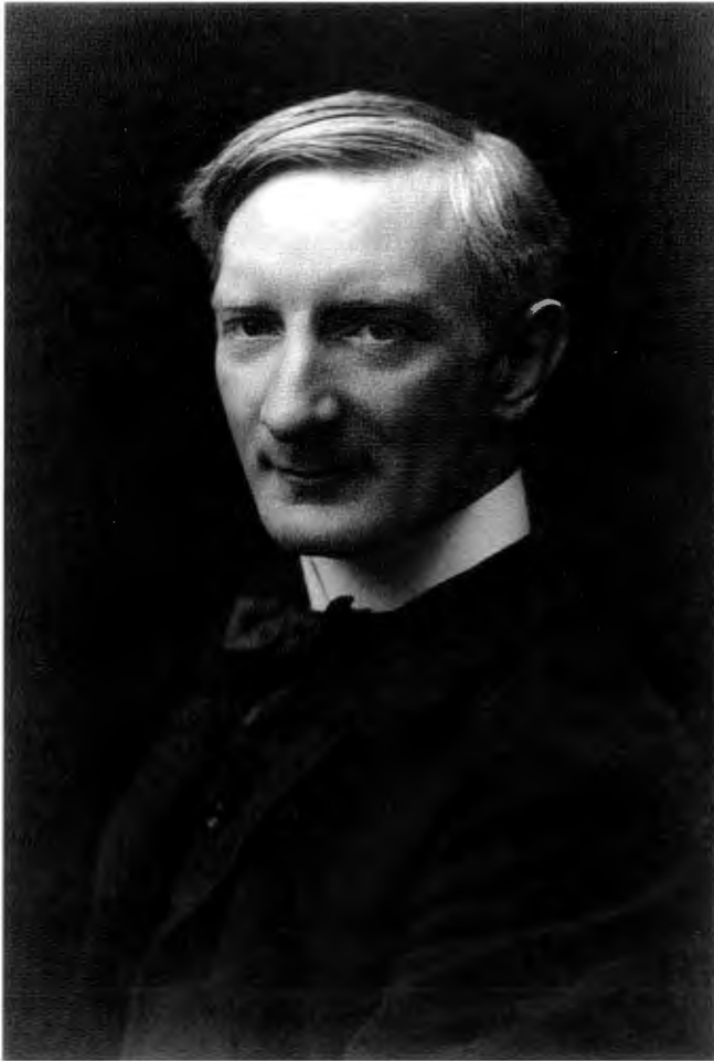
William Beveridge, brittisk socialreformator.

skulle finnas en yrkesskadeförsäkring och yrkesskadade får efter 13 veckor ersättning enligt inkomstbortfallsprincipen. Ersättningstiden var i princip obegränsad men arbetslösa var t. ex. skyldiga att genomgå omskolningskurser.