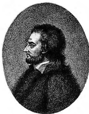
Johan Jacob Anckarström, 1762–1792.