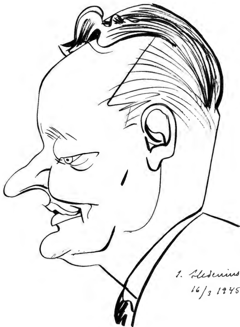
Ingemar Hedenius. Okänd tecknare, 1945.