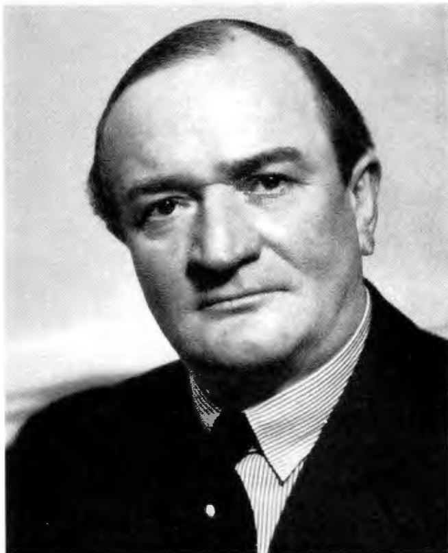
Gustav Möller, långvarig socialdemokratisk socialminister.

igenom skulle också fattigvården definitivt avskaffas.