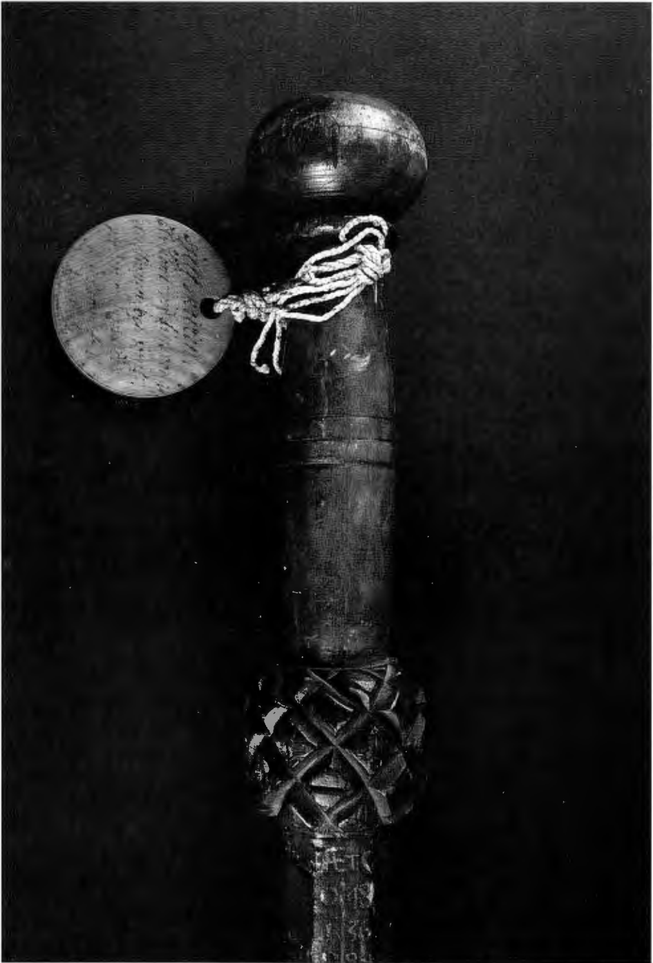
Kalenderstavens handtag med vidhängande träbricka som upplyser om att staven skurits av och senare tillhört Gustav Vasa.