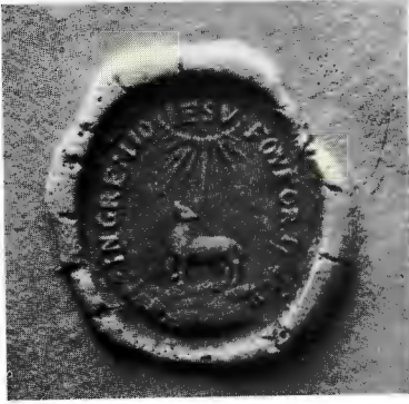
Fig. 6. Biskopen i Åbo Johannes Gezelius d. y:s sigill 1683. Skala 2 : 1. Borgensförbindelse för Gezelius' svåger. Hos förf.