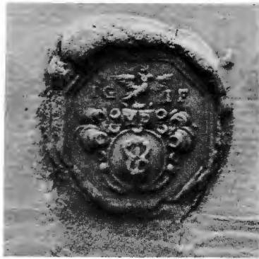
Fig. 5. Biskopen i Åbo Johannes Gezelius d. y:s sigill 1714. Skala 2 : 1. Biografica, RA. Vapnet överensstämmer med ett använt år 1681.