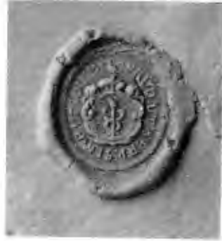
Fig. 3. Biskopen i Åbo Johannes Gezelius d. ä:s sigill 1682. Skala 2 : 1. Riksdagsacta i Rikstens ständers förklaring 1682, RA.