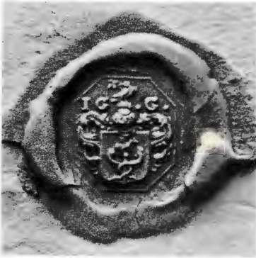
Fig. 2. Dåvarande generalsuperintendenten i Livland sedermera biskopen i Åbo Johannes Gezelius d. ä:s vapen. Skala 2 : 1. Skrivelse från Gezelius till Carl Gustaf Wrangel 1664. Skoklostersaml., RA. Vapnet överensstämmer med ett sigill använt under Dorpattiden 1649.