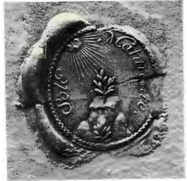
Fig. 7. Biskopen i Åbo Johannes Gezelius d. y:s sigill 1711. Skala 2 : 1. Skrivelse från Gezelius till Ulrika Eleonora d. y. Kungl. arkiv. Skrivelser till Ulrika Eleonora d. y. Ser. I folio, RA