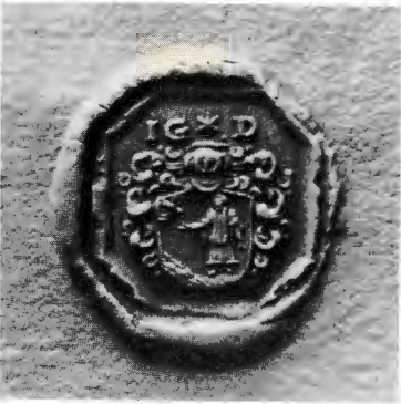
Fig. 4. Biskopen i Åbo Johannes Gezelius d. ä:s sigill från 1680-talets slut. Skala 2 : 1. Skrivelse från Gezelius till Gustaf Adolf de la Gardie. De la Gardieska saml., RA.