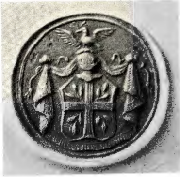
Fig. 8. Johannes Olivecreutz' adliga vapen. Skala 2 : 1. RA:s heraldiska sektion.