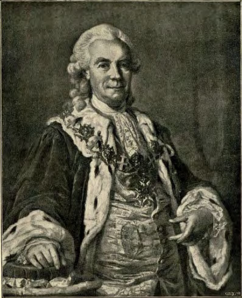
FRIHERRE CARL SPARRE. ÖFVERSTÅTHÅLLARE I STOCKHOLM 1773—1791. (OLJEMÅLNING TILLHÖRIG MAGISTRATEN I STOCKHOLM.)