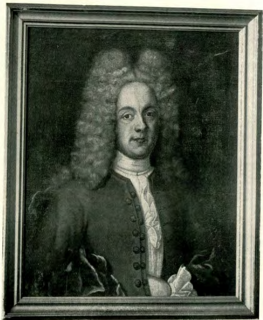
OLOF ESTENBERG 1680—1752 Kansliråd.