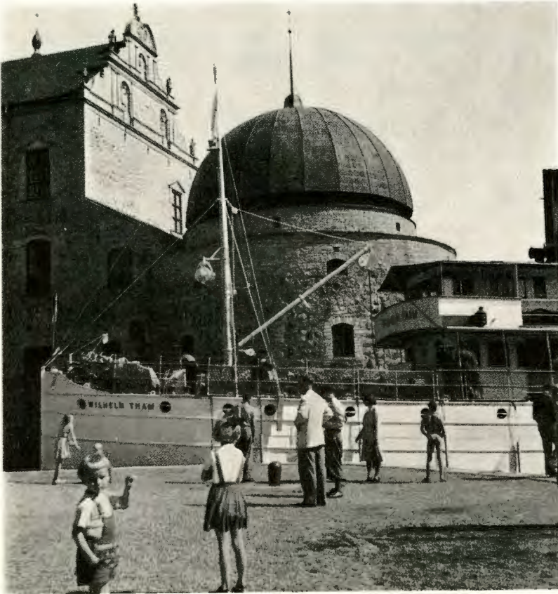
Vadstena slotts nordvästra valltorn. Foto: Ville Hansson, Vadstena, 1948. Föreningen Gamla Vadstenas fotosamling.

kollsutdrag. Då detta dröjde, anhöll Örnberg skriftligt om ett sådant, men fick då till svar av Björck, att något sådant inte kunde sändas, då beslutet inte hade tagits till protokollet. Man förvånar sig inte över att Örnberg blev upprörd över hamndirektionens självrådighet och ohövlighet och betraktade det som en hämnd för hans åtgärder i samband med seglarfesten ett par månader tidigare.