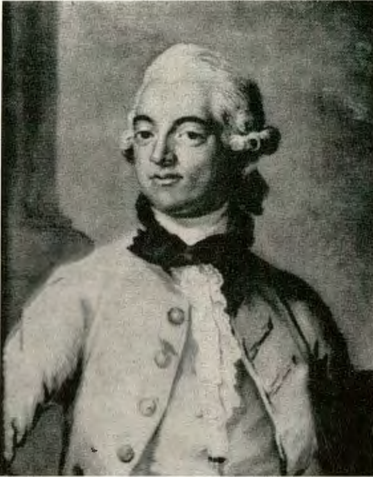
Fig. 4. Jean Fredric Bedoire, f. 1746; †1830. Brukspatron, godsägare.

Pastell av Gustaf Lundberg 1775. Äg. Majorskan Elin af Geijerstam, f. Lundquist, Sällinge.