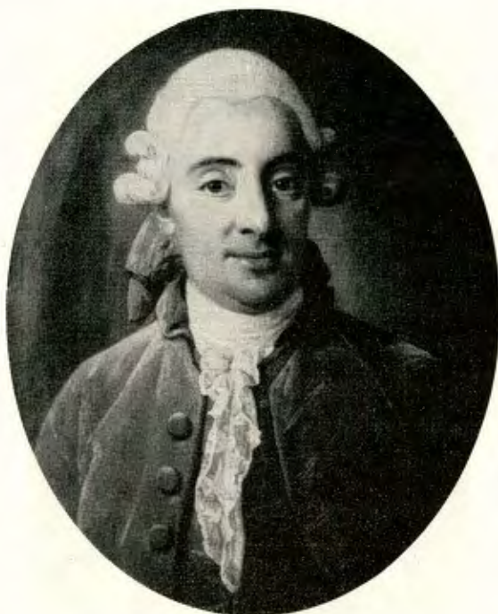
Fig. 8. Jean de Bedoire, f. 1728; †1800. Ceremonimästare, landshövding.

Oljemålning av Per Krafft d. ä. 1773. Äg. Friherre Eric Hajj, Onsjö fideikommiss, Vänersborg.