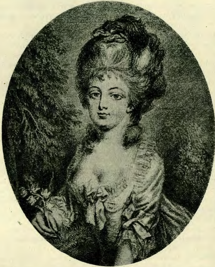
Sophie Hagman. Gravyr av Elias Martin år 1786.