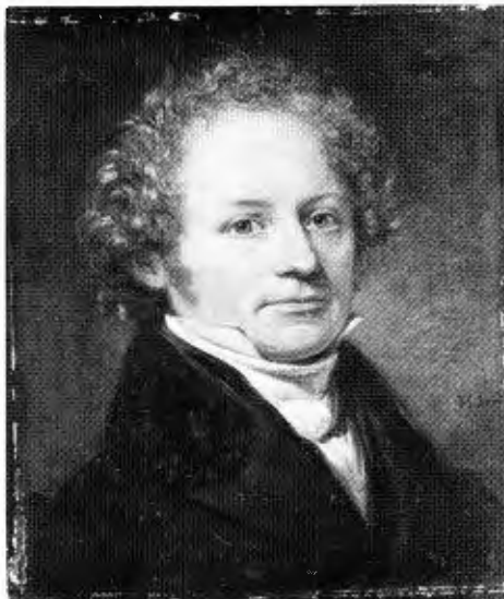
J. G. Sandberg: P. D. A. Atterbom, sign. 1831. O.p.t., 23 x 19 cm. Statens porträttsamling på Gripsholm. Porträttet togs av okänd anledning inte med i det litografiska planschverket.

den yttre likheten 12 . Looström åter finner att samma kritiker gav Sandbergs porträtt företräde framför Westins 13 . Södermark, som etablerade sig som porträttmålare först tio år efter Sandberg, nämner han däremot inget om. I ett brev från 1843 framhåller dock Sandberg själv Södermark som landets främste då levande porträttmålare 14 . Detta yttrande kan naturligtvis tolkas som ett utslag av blygsamhet men kan lika gärna ha baserats på övertygelsen att Södermark var honom överlägsen. Under alla omständigheter fanns det från 20-talet inga andra jämförbara auktoriteter på porträttmåleriets område.