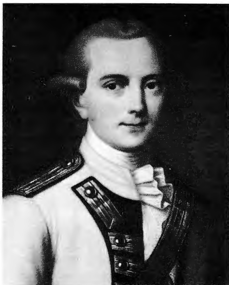
Generallöjtnanten friherre Evert Wilhelm Taube. Okänd konstnär; kopia av J.P. Södermark.

upon the affairs of Poland, quickly concluded the Peace of Värälä with Sweden the following month on the basis of the status quo ante.