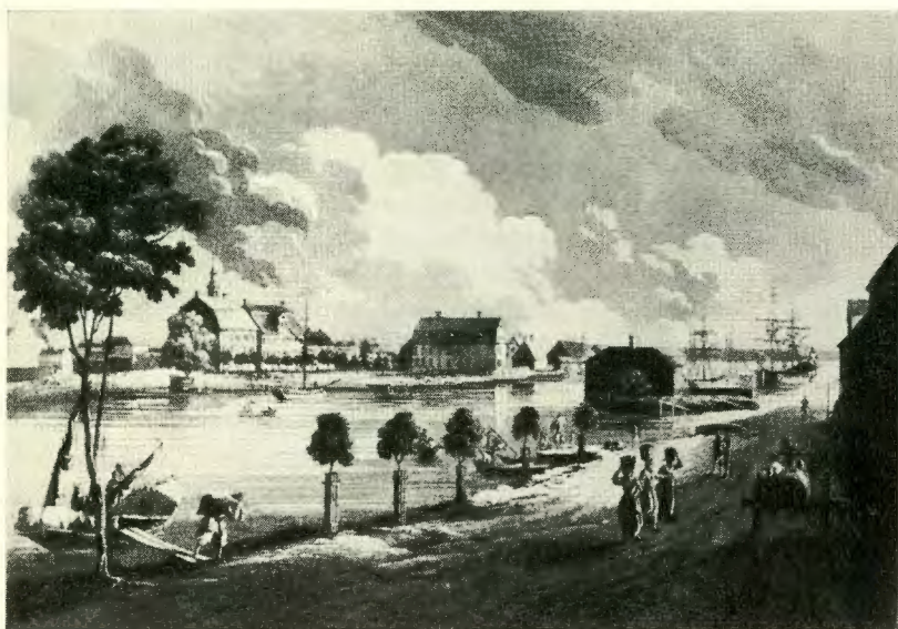
Norrköping omkring år 1800. Akvatint av J. F. Martin.