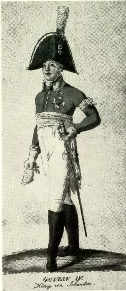
Konung Gustav IV Adolf. Färggravyr.