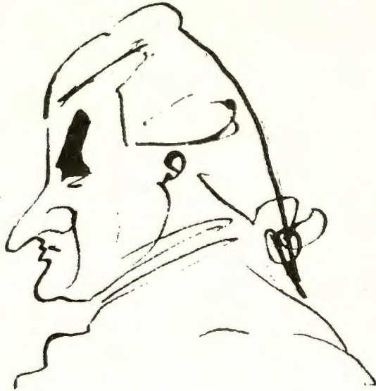
Greve Johan Christoffer Toll. Teckning av Ehrensvärd.

Denna Anekdoternas förklaring, som tydligen var ganska allmän på denna tid, 46 motsäges bl. a. av Hedvig Charlotta i hennes dagbok. »Jag har svårt att tro påståendet, att Toll i smyg motarbetat hertigen» 47 säger hon, och senare omtalar hon, som ett försvar för konungen, att han »avhandlat ärendet med de fyra talmännen.» 47 Läser man Tolls inlägg i debatten, kan man svårigen undgå att märka dess brist på entusiasm. 48 Hans slutyrkande »att då realisationen vore gjord, och då icke trängande riksskulder det förhindrade, utbetala till deras kungl. högheter förenämnda summor (100 000 + 50 000 rdr) av de överskott, som kunna bli å fastställda fonderna» 49 är av en man i Tolls ställning som visste realisationens svårigheter, och hur osannolikt det var, att det skulle kunna bli överskott »å fastställda fonderna», icke något annat än ett artigt avslag. Detta undgår ej heller hertigarnas vänner, och A. G. Mörner, 50 påvisar, »att en mindre