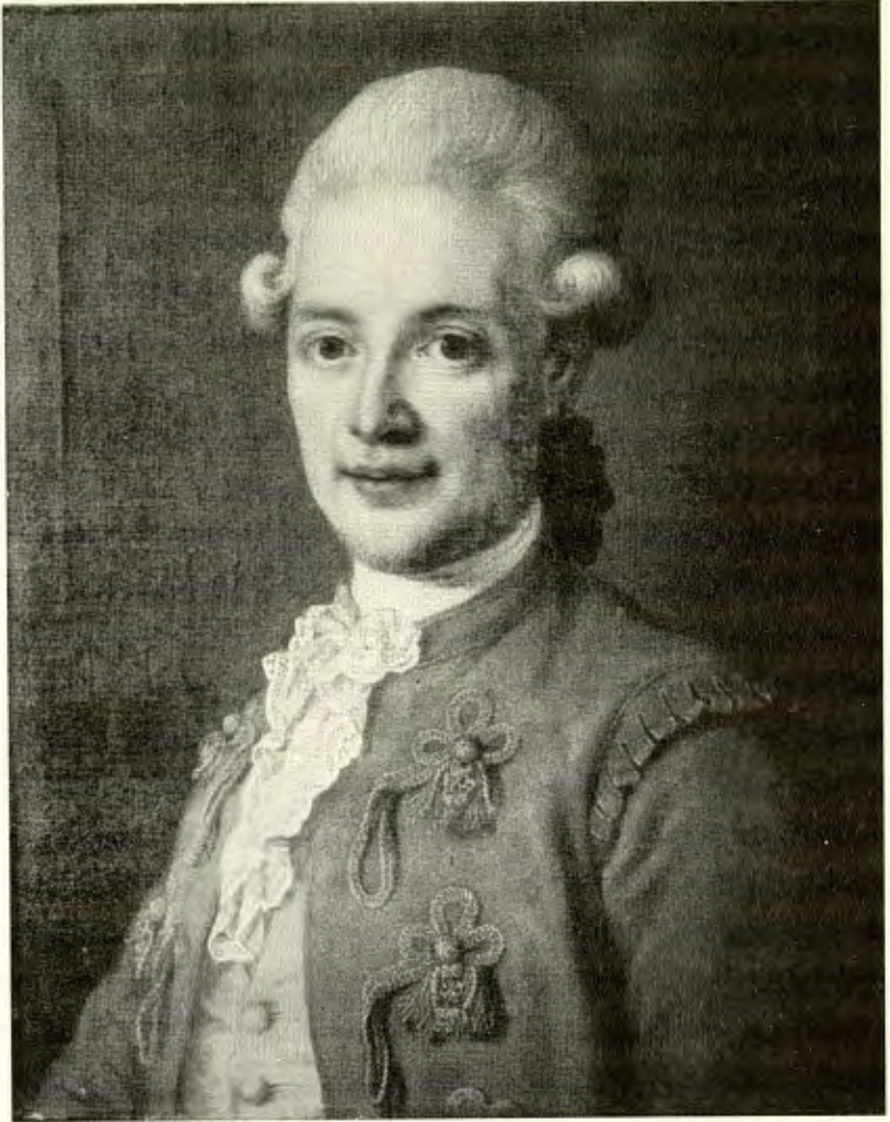
Greve Adolf Ludvig Hamilton. Målning av Ulrika Pasch.

en nations rättigheter: självbeskattning, krig, myntvaluation, personlig- och egendomssäkerhet» blevo nationen förbehållna. Snart märker han, att rådets egenskap av »motvikt mot kungamakten» 14 eliminerats, då det i realiteten ansvarar inför konungen allena. Det dröjer därför inte länge innan kritiken tilltar i skärpa.