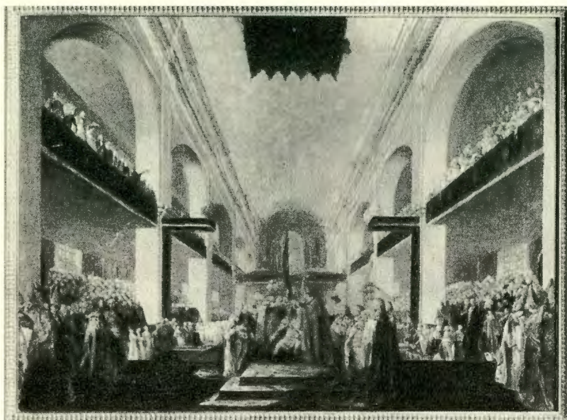
Gustav IV Adolfs kröning i Norrköping 1800. Oljeskiss av C. Fr. von Breda.