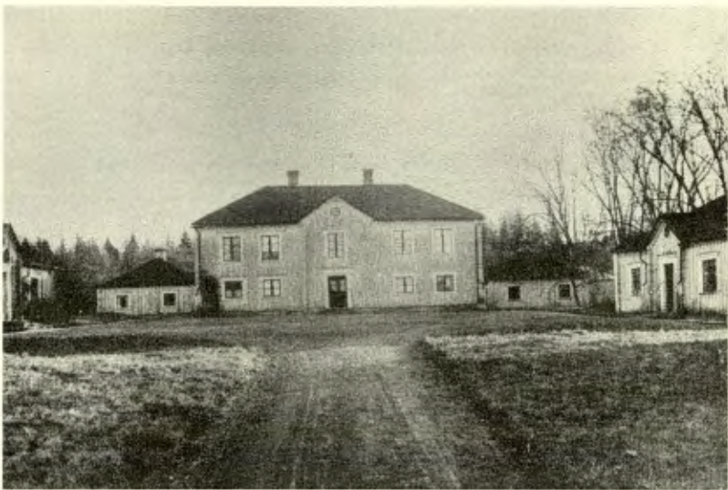
Blomberg. Oljemålning.

av nationalförsamlingen fått konstitutionella rättigheter efter det första flyktförsöket.